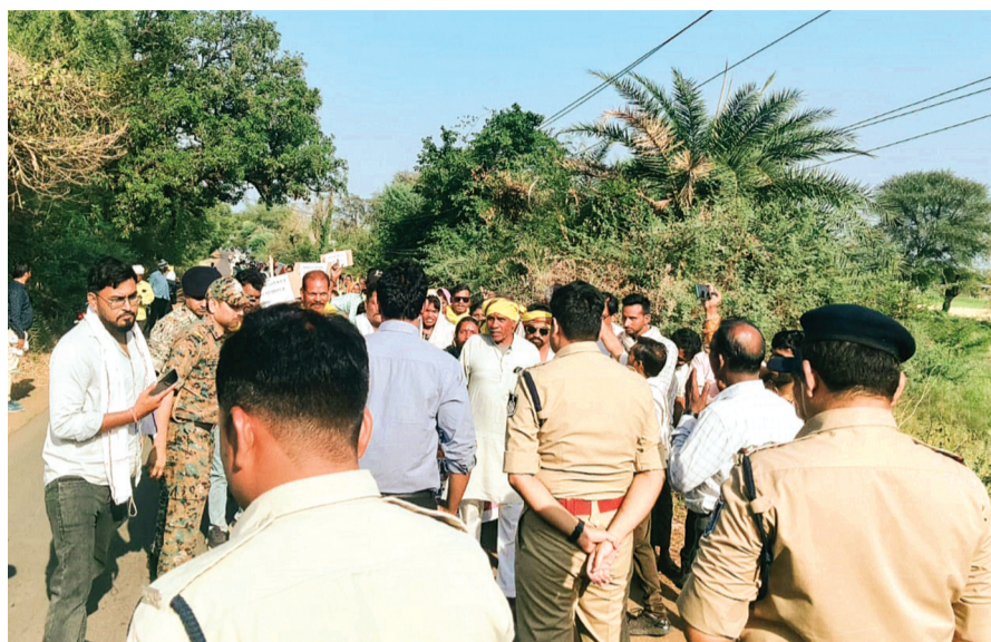
हरिभूमि न्यूज ▶▶ हरदा

जिले में प्रस्तावित मोरण्ड-गंजाल सिंचाई परियोजना के विरोध में आदिवासी समुदाय ने शुक्रवार को पैदल मार्च निकाला।