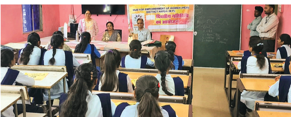
हरिभूमि न्यूज ▶▶ हरदा